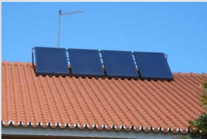
hydroSmalt RR + hydroUnit