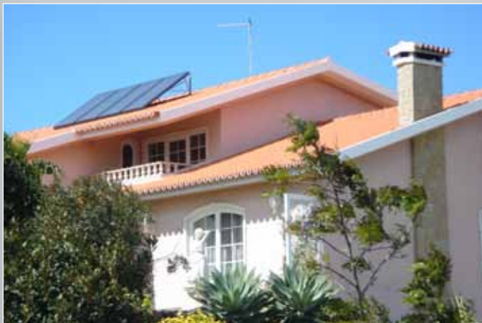
hydroSmalt RR + duoStar