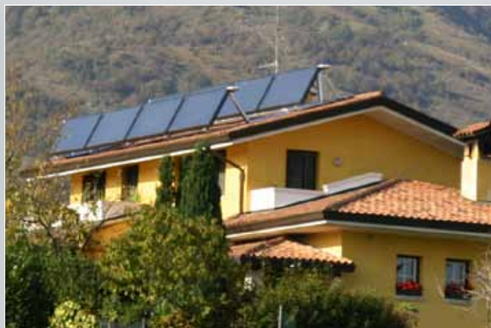
hyGenio R + duoStar